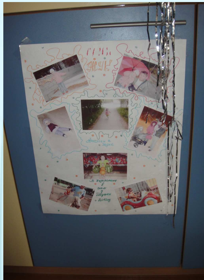
Стенгазета «Моя семья»