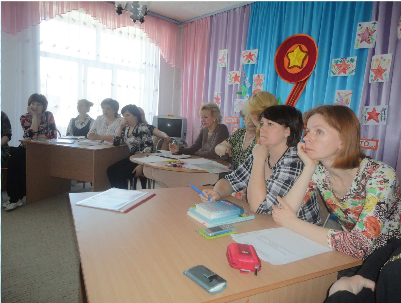
Проведение педагогического совета