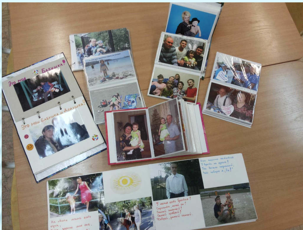
Фотоальбомы «Моя семья»